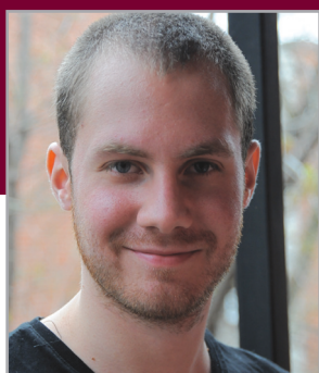
Tableau d'honneur de l'excellence 2012 1 er rang