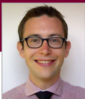
Tableau d'honneur de l'excellence 2011 1 er rang