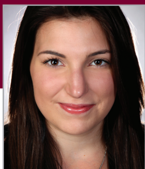
Tableau d'honneur de l'excellence 2012 2 e rang ex aequo